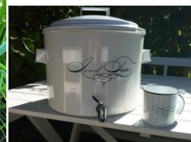
Istebehållare m. mugg