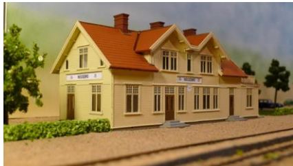
Byggsats Nossebro stationshus