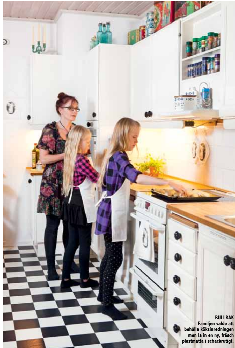
BULLBAK Familjen valde att behålla köksinredningen men la in en ny, fräsch plastmatta i schackrutigt.

S tåtliga villa Nord i Ulricehamn byggdes för snart 100 år sedan som pensionat för patienter från det gamla sanatoriet strax intill. Pensionatsvärdinnan fröken Nord, som lät bygga den 230 kvadratmeter stora patricier-villan 1914, lär ha varit både förmögen och modern för sin tid och installerade vattenburen värme istället för kakelugnar. Men även om huset byggdes med gedigna material och med moderna tekniker har det förstås genomgått en hel del renoveringar under åren.