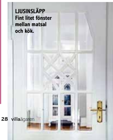
LJUSINSLÄPP Fint litet fönster mellan matsal och kök.